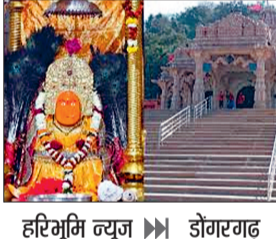
हरिभूमि न्यूज़ डोंगरगढ़