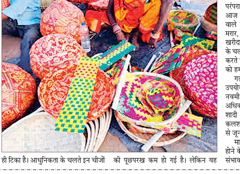
ही टिका है। आधुनिकता के चलते इन चीजों की पूछपरख कम हो गई है। लेकिन यह

होली च्यौराह मना लेने के बाद अब बाजार में शादी के सामानों की पूछ परख शुरू हो गई है। वैसे तो देव उठनी एकादशी के बाद से ही शादी का सिलसिला शुरू हो गया है। मगर छत्तीसगढ़ एवं पारंपरिक विवाह का सिलसिला अब शुरू हो रहा है। जिन्हें देखते हुए नगर में शादी व्याह के उपयोगी सामानों की खरीदी जमकर की जा रही है। अंचल के साप्ताहिक बाजारों में शादियों में उपयोग में आने वाले झांपी टोकनी, परा, सूपा, मऊर, पगड़ी-हार, कलगी-दुकानों में सजा ली गई है। 30-40 वर्षों से इस व्यवसाय से जुड़े नगर के व्यापारियों ने बताया कि, होली जलने के बाद से शादी का सीजन शुरू हो जाता है। उन्होंने आगे कहा कि, पारंपरिक वस्तुओं का यह बाजार ग्रामीण खरीददारों पर