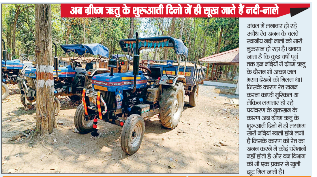
अब वीज्ज ऋतु के शुरूआती दिनों में ही सूख जाते हैं नदी-नाले

कबीरधाम जिले के वन परिक्षेत्र रेंगाखार जंगल क्षेत्र के स्थानीय नदी नालों से वृहद पैमाने में अवैध रेत का खनन किया जा रहा है। जिसकी शिकायतें लगातार मिलने के बाद नई से जागे वन विभाग ने अवैध रेत खनन के खिलाफ कार्यवाही करते हुए करीब आधा दर्जन रेत से भरी ट्रैक्टर ट्राली जप्त की है। वन विभाग ने इन अवैध रेत खनन करने वालों के खिलाफ क्या कार्यवाही की है वे इसकी जानकारी देने में कतरा रहे हैं। ऐसे में लग यही रहा है कि यह सिर्फ खानापूर्ति कार्यवाही है। गौरतलब है कि जिले के रेंगाखार जंगल परिक्षेत्र से लेकर आसपास के वनांचल में लम्बे समय से अवैध रेत खनन का कार्य जोरों पर चल रहा है। रेत तस्क़र बड़े ही बेखौफ ढंग से यहां प्रतिदिन सैकड़ों ट्रैक्टर ट्राली रेत पार कर रहे हैं। सूत्रों की माने तो यहां के स्थानीय नदी नालों से निकाली गई रेत खेरागढ़, मध्य प्रदेश के मलाजखंड दमोह क्षेत्र तक जा रही है वही रेंगाखार से दूर साल्हेवारा, लोहारा, चिल्मी क्षेत्र में इस रेत को धड़ल्ले से बेचा जा रहा है। जिसकी शिकायतें क्षेत्र के जागरूक वन प्रेमियों द्वारा लगातार की जा रही हैं। इसी कड़ी में वन विभाग की टीम ने अब कुछ लोगों को रेत का अवैध परिवहन करते दबांचा है।